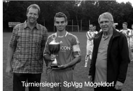
Turniersieger: SpVgg Mögeldorf