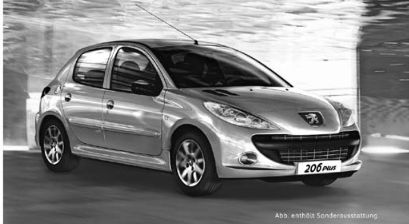
Abb. enthält Sonderausstattung