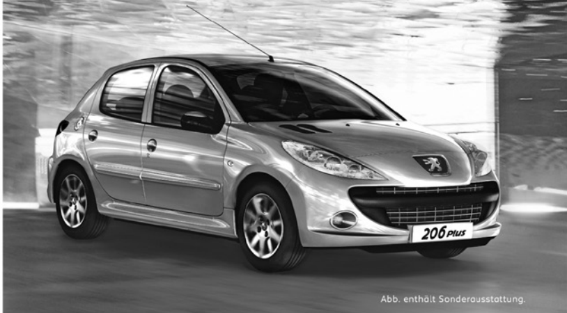
Abb. enthält Sonderausstattung.