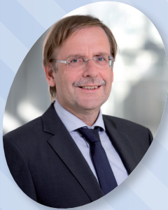
Rainer Koch Präsident des Bayerischen Fußball- Verbandes